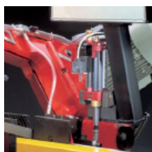
» Ski stop