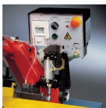
» Bajada controlada