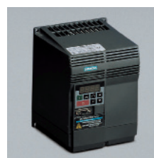
» Variador electrónico