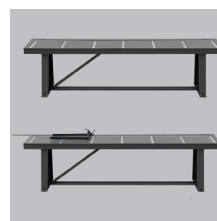
» Caminos de rodillos