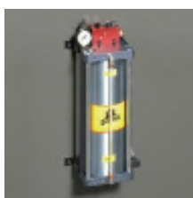
» Dispositivo de corte en seco